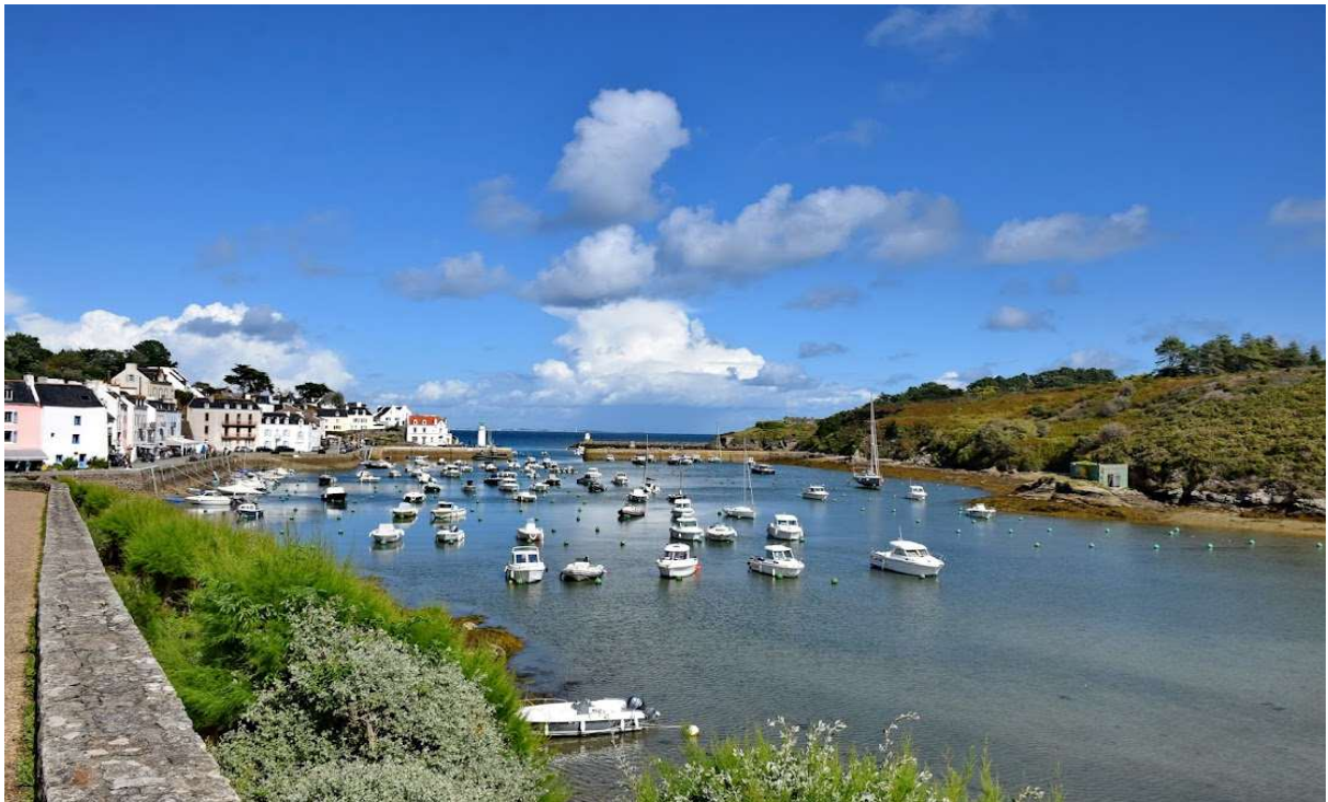
PORT DE SAUZON