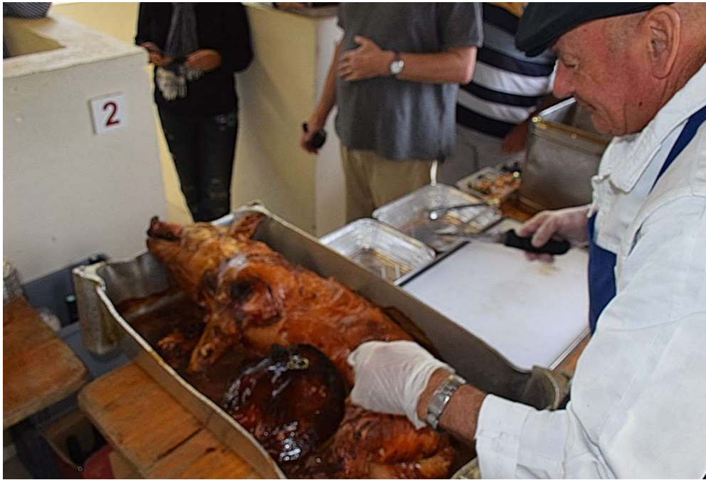
Visite de la ville de QUIBERON