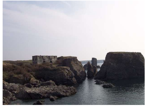
POINTE DES POULAINS et LE FORT DE SARAH BERNHARDT